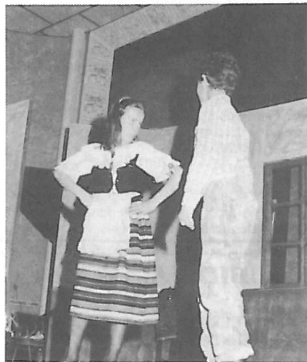
Un momento de la representación de las 4 farsas