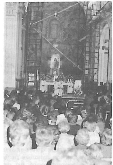
Monseñor resaltó, con motivo, la atención que las gentes de este Pueblo le dispensó en todos los actos que por su visita se realizaron.